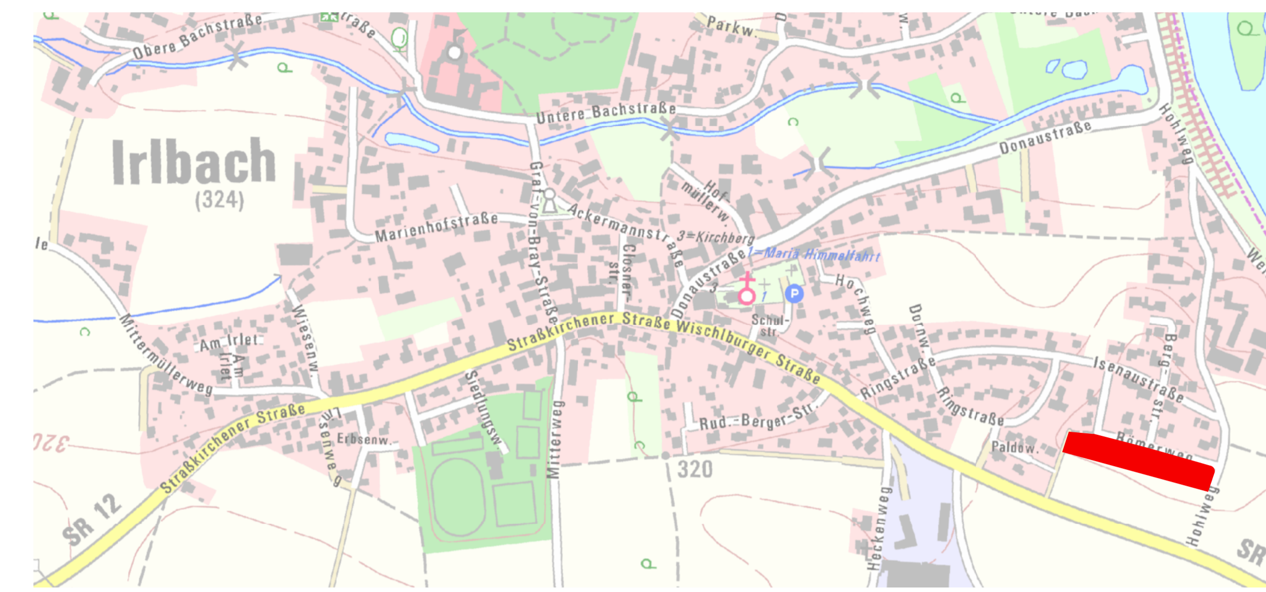
Übersichtsplan M 1:5000