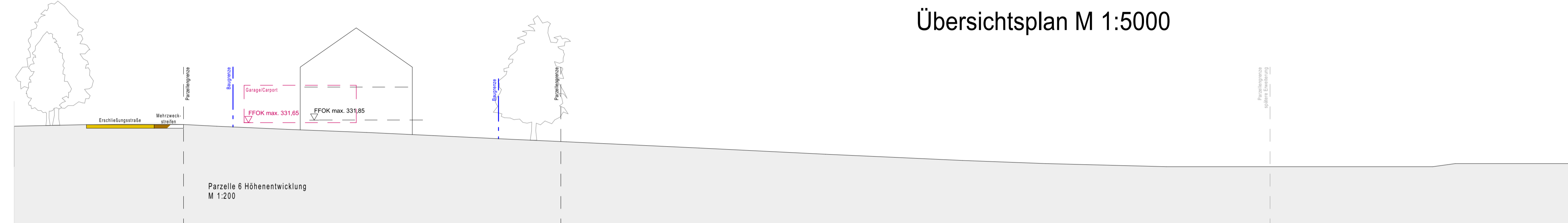
Systemschnitt-Höhenentwicklung 1 - 1 M 1:200